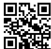
デジエントリーQRコード